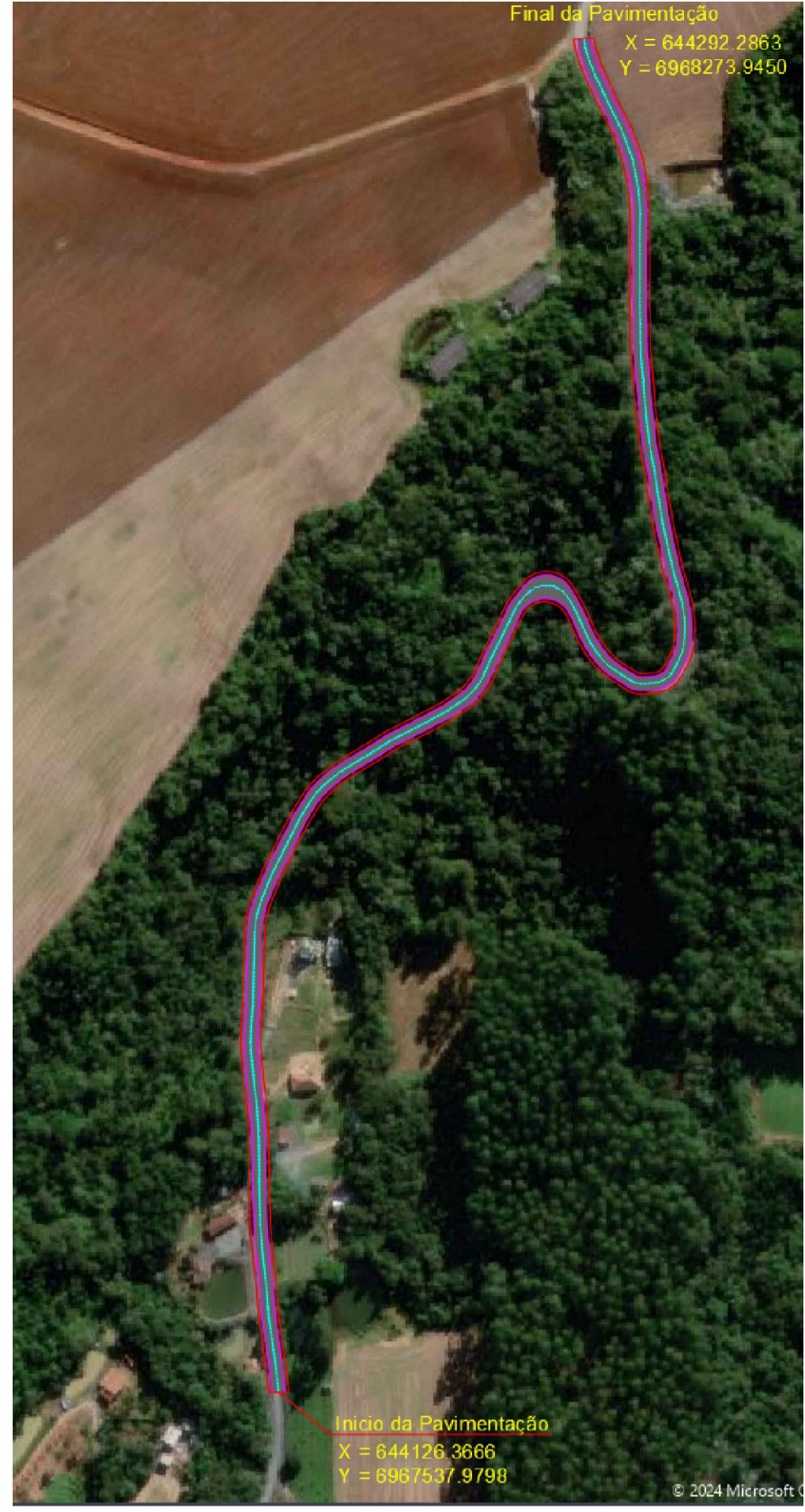
PLANTA LOCALIZAÇÃO ESCALA.....SEM